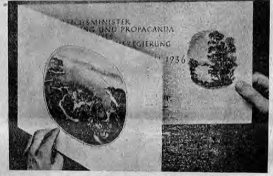
El doctor Goebbels vive a todo lujo. Esta invitación, que mide 63 cms. por 22, e impresa a cinco colores, fué enviada a 2.000 invitados a una de sus fiestas.

rios de la medida, Hitler deseaba ganar el apoyo de los industriales, se oponía. Así que Hitler convocó otro congreso del partido en febrero de 1926, en que se llamó a cuentas a Strasser y a Goebbels. Como resultado se unió al grupo del partido que apoyaba a Hitler, rompiendo con Strasser. Hitler, como recompensa, le hizo Gauleiter de Berlín, bajo condición de que abandonara sus simpatías socialistas y prometiera no tener más que ver con el bolchevismo. En la capital del Reich Goebbels se probó como un excelente agitador político, y organizador de "es cuadradas de defensa" nazis. Fundó el periódico Der Angriff en 1927, en que atacaba a los grandes negocios, a los bancos, a los católicos, a los judíos, a los franceses, a quienes profesaba singular antipatía — y aun al presidente Hindenburg. Der Angriff (El Ataque) no era sólo el órgano militante del partido, sino también un periódico opuesto al Volkischer Beobachter , diario oficial del partido, editado por el doctor Rosenberg con quien Goebbels no simpatizaba. Comenzó como semanario; en 1929 era ya bi